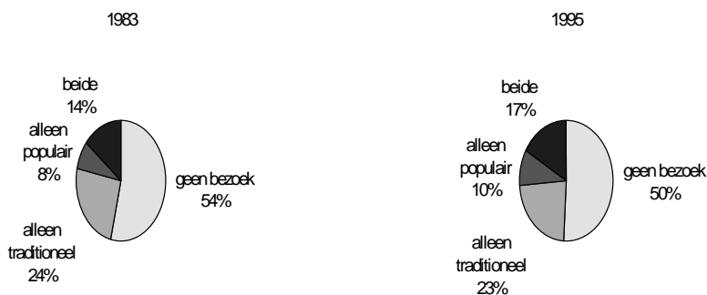
Figuur 4.3 Bezoek aan culturele instellingen, naar traditionele a en populaire b cultuur, bevolking van 6 jaar en ouder, 1983-1995 (in procenten)

a klassieke muziek, ballet, beroepstoneel en musea